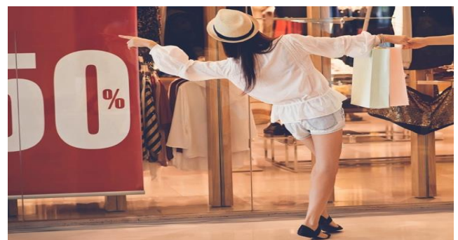
προϊόντος στους καταναλωτές,